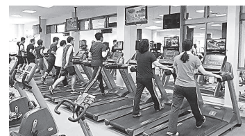
まずは無理なく運動したい! ジムでランニングマシン+筋力トレーニング