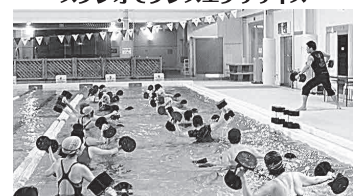
全身運動で腰痛緩和や健康維持! プールでアクアエクササイズや水中歩行